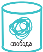
Метална кутия „Свобода“